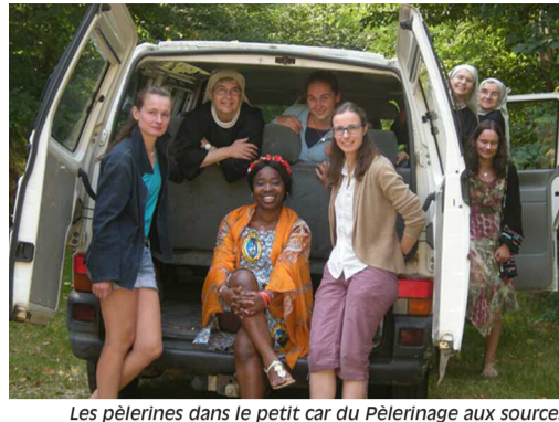
Les pèlerines dans le petit car du Pèlerinage aux sources