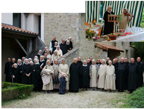
Journée monastique du 26 juillet

Dimanche 8 octobre : juste 18 ans après notre arrivée à Pié-Foulard, les oblats, amis et proches du monastère viennent découvrir nos lieux. Après les vêpres, durant le repas partagé, chacun exprime ce que représente pour lui la communauté, notre présence. Ce moment fraternel tout simple, resserre les liens.