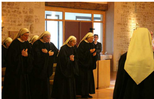
Chant du suscipe