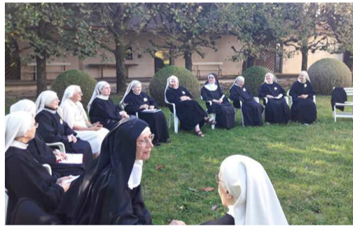
Rencontre dans la cour l'après-midi