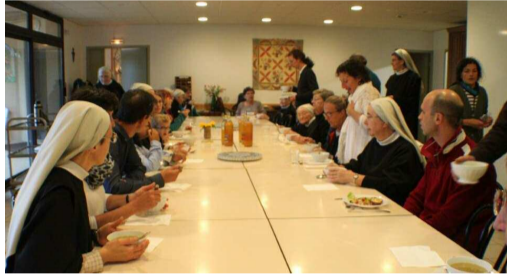
Repas partagé du 8 octobre