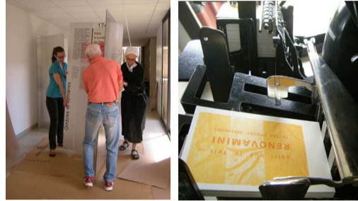
Montage de l'Exposition Impression des cartes Renovamini