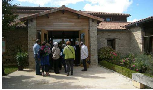
Journée des Portes ouvertes 17-18 septembre