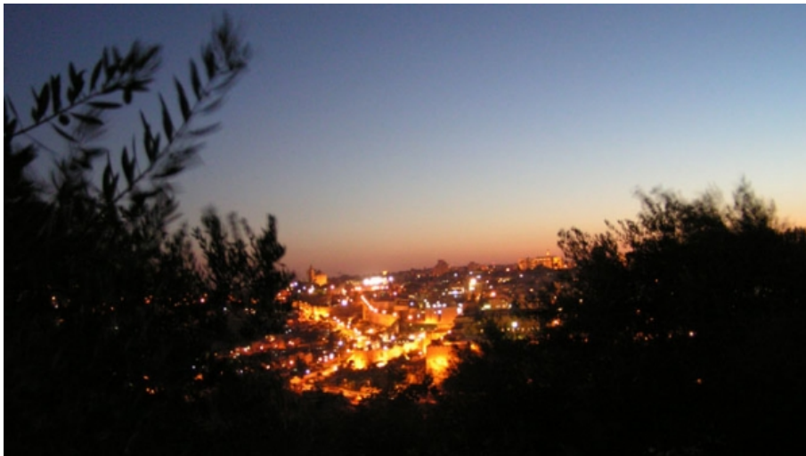
Vue de Jerusalem scintillant au soleil couchant.

Retrouvez les références des textes en pdf